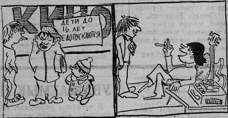
Рисунок Ярослава Голофриша.

Когда нет шестидцати... и родителей дома.