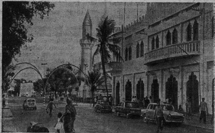
Столица Сомали Могадишо по праву считается одним из красивейших городов на африканском побережье Индийского океана.