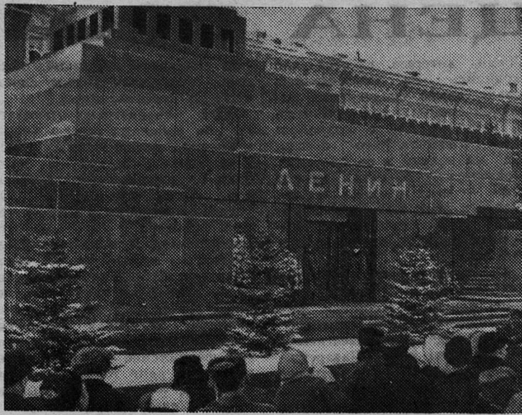
Москва. Январь 1971 года. У Мавзолея В. И. Ленина.

В решении исполкома намечены меры дальнейшего улучшения работы городского и сельских Советов депутатов трудящихся.