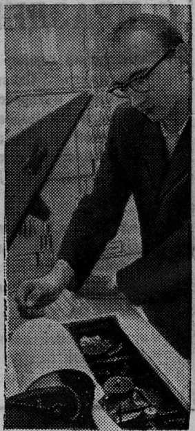
Челябинская область. На складе заготовок обжимного цеха № 1 Магнитогорского металлургического комбината смонтирована информационная система.

Центральный Комитет КПСС обязал ЦК КП союзных республик, крайкомы и обкомы партии усилить контроль за деятельностью государственных, хозяйственных и общественных организаций по экономическому образованию и воспитанию трудящихся. Партийным, профсоюзным и государственным органам рекомендовано ввести в практику ежегодное подведение итогов экономического обучения.