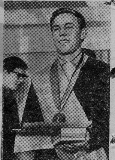
«Эффективными формами участия молодежи в социалистическом соревновании стали конкурсы по профессиям».

(Из Постановления ЦК КПСС «О дальнейшем улучшении организации социалистического соревнования»).