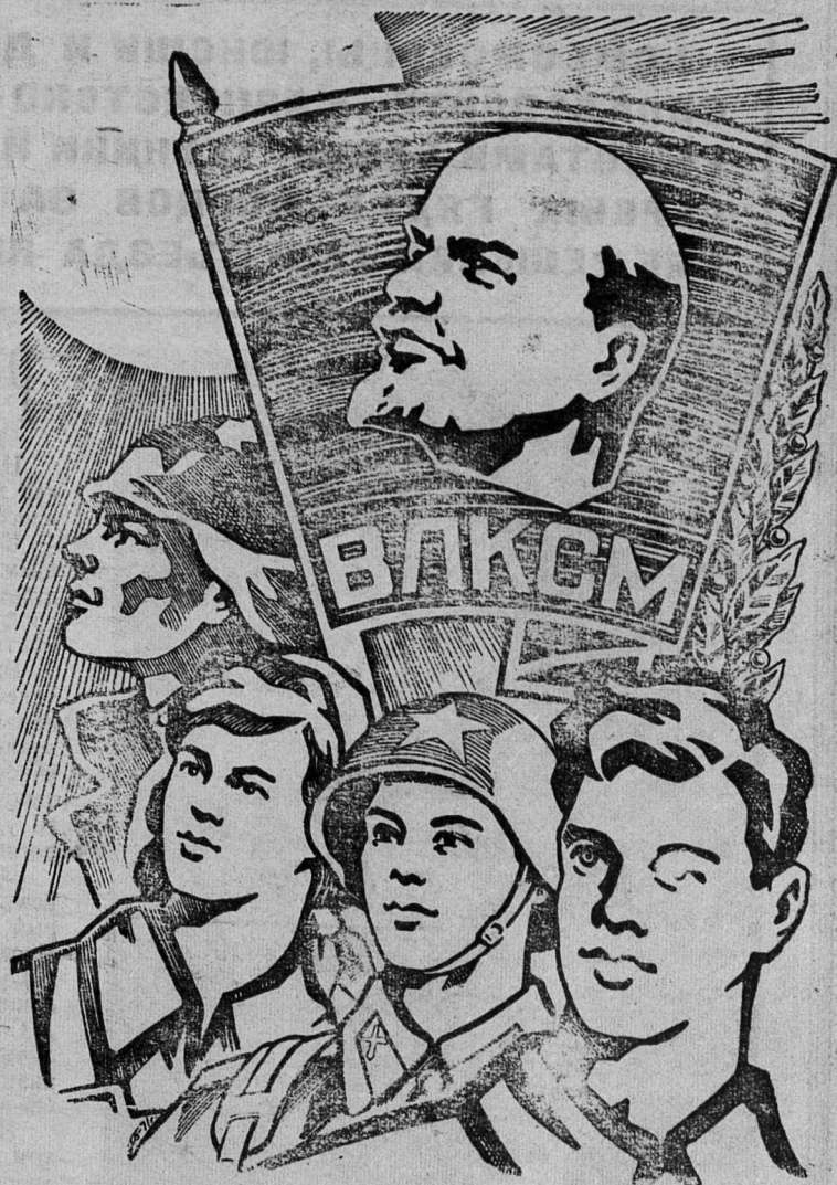
Рисунок художника С. Гринько.