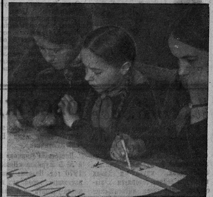
Редколлегия стенной газеты 6 «Б» класса школы № 5 за выпуском очередного номера.

конкурсы. И в соревновании по общественной работе мы по праву оказались впереди. Когда моих октябрят спрашивают, как они проводят время, те в один голос отвечают: «Весело, интересно!». Это мне приятно слышать. Таня ФЕДОРОВА, вожатая из 5 «Б» класса, школа № 3.