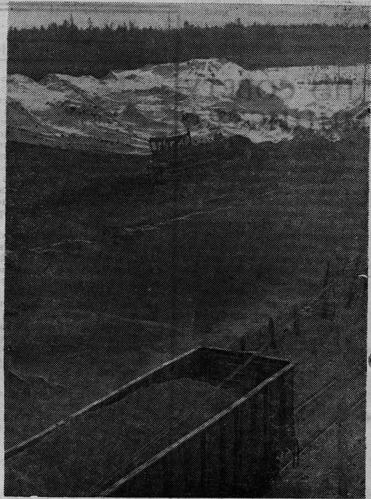
Склад мелкого сланца третьей шахты. Ежедневно по железной дороге на ТЭЦ сланцеперерабатывающего комбината «Сланцы» и Прибалтийскую ГРЭС отсюда отправляют сотни тонн горючей массы.