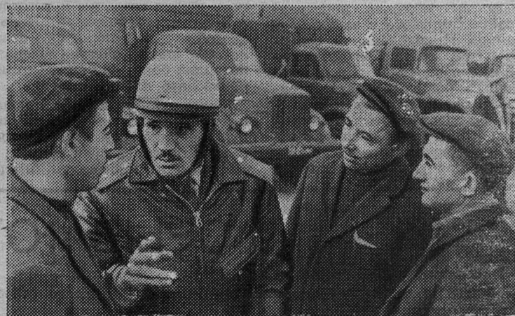
«Поставить сельскому хозяйству за пятилетие... 1.100 тыс. грузовых автомобилей...».

Пусть крепнет и развивается братская дружба и боевая солидар- ность между вьетнамским и совет- ским народами!».