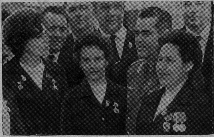
Москва. XXIV съезд КПСС.

На снимке: летчики-космонавты СССР Герой Советского Союза В. В. Николаева-Терешкова и дважды Герой Советского Союза генерал-майор авиации А. Г. Николаев с делегатами съезда.