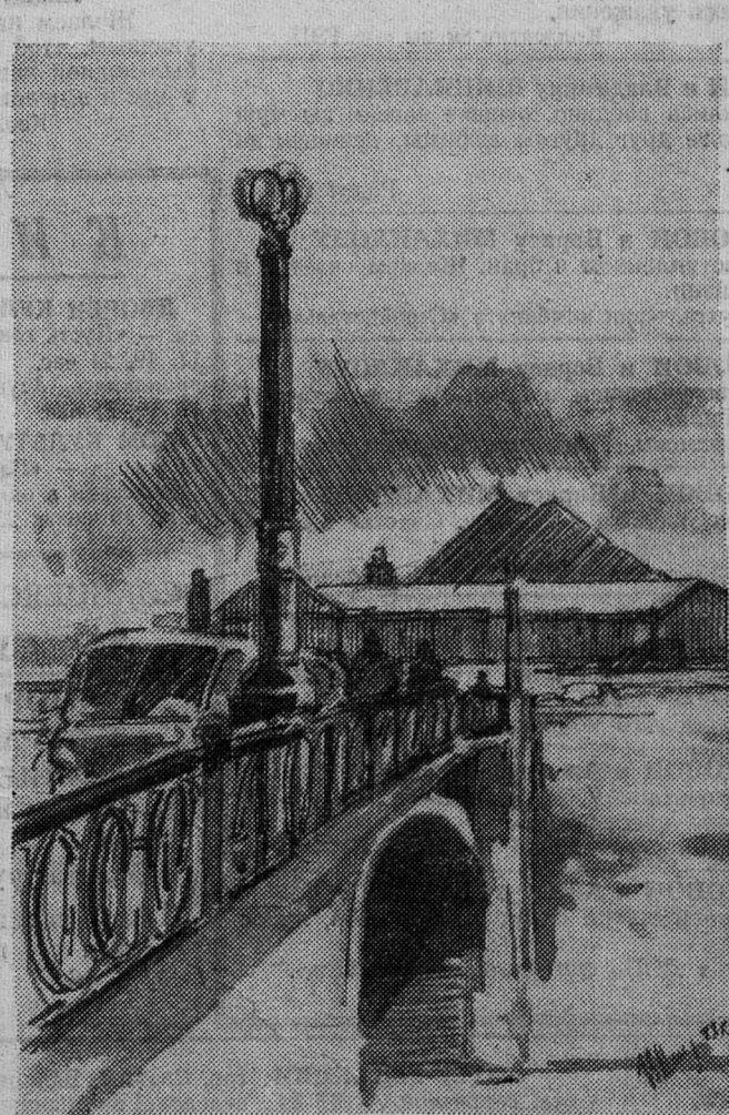
Мост через Плюсю.