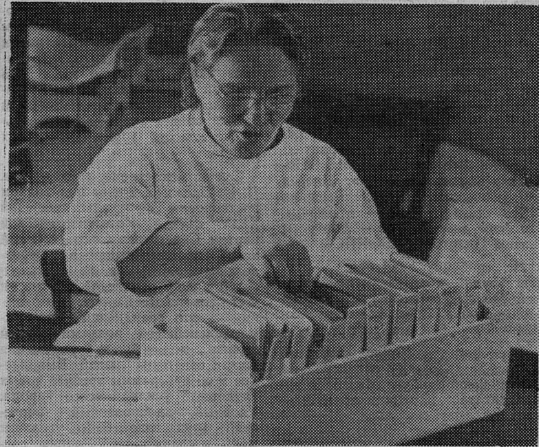
Вот уж несколько лет на центральной усадьбе совхоза «Родина» в деревне Выскатка работает медицинский пункт. Здесь работают опытные фельдшера, которые проводят периодические медосмотры, делают профилактические прививки и при том или ином заболевании оказывают вполне квалифицированную помощь. Имеется также прекрасный зубоврачебный кабинет.

Свыше часа длилась первомайская демонстрация, в которой приняли участие более десяти тысяч человек.