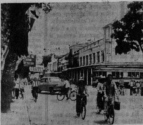
НА СНИМКЕ: на одной из улиц Ханоя.

на улицах — бомбоубежища, не покинули своих позиций тяжелые зенитные орудия и ракетные установки, образующие щит противовоздушной обороны столицы ДРВ, проводят учения бойцы отрядов самообороны. Время от времени над городом пролетают самолеты. Ханой на чеку. Ведь почти каждый день американская авиация нарушает воздушное пространство республики.