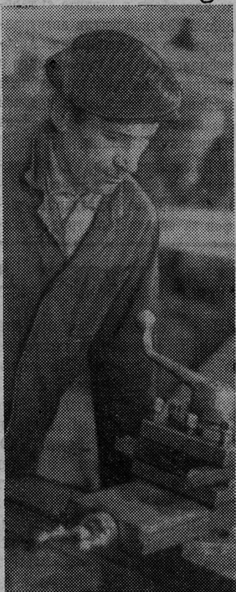
В его трудовой книжке 32 записи о различных поощрениях.