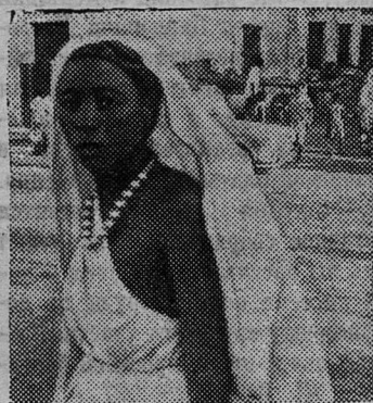
Могадिशо. Горожанка. Хотя сомалийцы чтят законы корана, большинство жителей крупных городов не закрывают свое лицо чадрой.

ческие коллекции многих стран. Здесь хорошо акклиматизировались несколько полярных медведей.