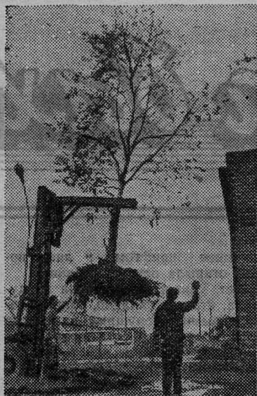
Южно-Сахалинск — центр Сахалинской области. Он еще молод, этот город.

Рекомендуются к подписке новый научно-популярный журнал «Человек и закон», уже приобретший большой круг читателей; журналы по профессии любой отрасли промышленности и сельского хозяйства и многие другие журналы. «Союзпечать».