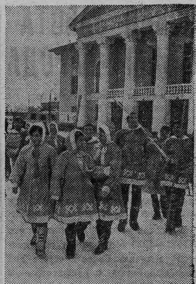
КОМИ АССР. Агитбригада Дома культуры речников Печоры — частый гость у тружеников севера. Самодеятельные артисты города выступают с концертами перед речниками, лесосплащиками, нефтяниками, оленеводами.