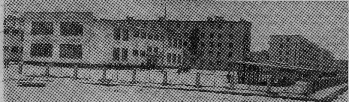
ГОРОД СЛАНЦЫ СЕГОДНЯ. Третий микрорайон.