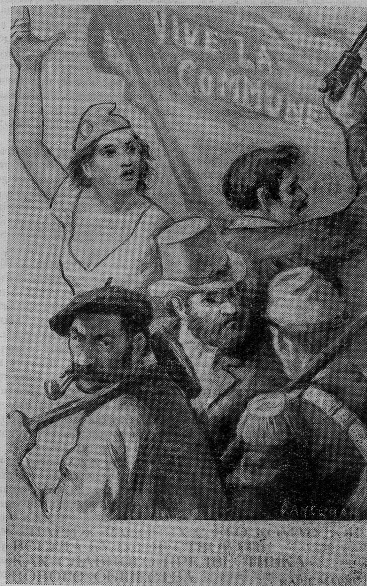
Париж рабочих с его Коммуной всегда будут чествовать как славного предвестника нового общества.

Картины, посвященные людям Парижской Коммуны, в разное время создали ленинградские художники М. Рудницкая, Л. Вольштейн, П. Королев и другие.