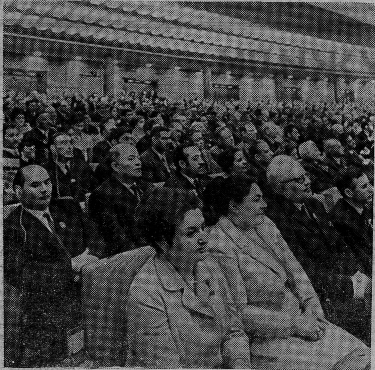
МОСКВА. XXIV съезд КПСС.

На снимке: в зале Кремлевского Дворца съездов во время заседания.