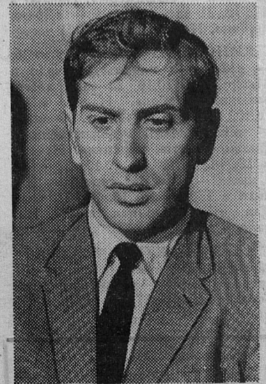
НА СНИМКЕ: Роберт Фишер.

Матч состоит из 24 партий и будет продолжаться, пока один из противников не наберет 12,5 очка. Если матч закончится вничью, Борис Спасский сохранит титул чемпиона мира.