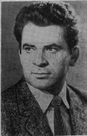
НА СНИМКЕ: Борис Спасский.

Велик интерес к матчу и у сланцевчан. И не только у любителей шахмат. Впервые за послед-