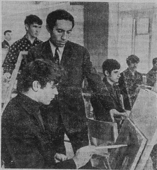
В педагогическом институте Махачкалы открыт новый факультет — художественно-графический. На первый курс принята талантливая молодежь, среди них народные умельцы из аулов Кубачи, Балхары, Унцукуля.

Отсюда вывод один: комсомольские организации под руководством коммунистов призваны, используя опыт лучших коллективов, повсюду зажечь огонек творчества и дерзаний, звать молодых производственников к лучшему использованию рабочего времени и досуга. На это нацеливает и решение состоявшейся недавно VIII городской комсомольской конференции.