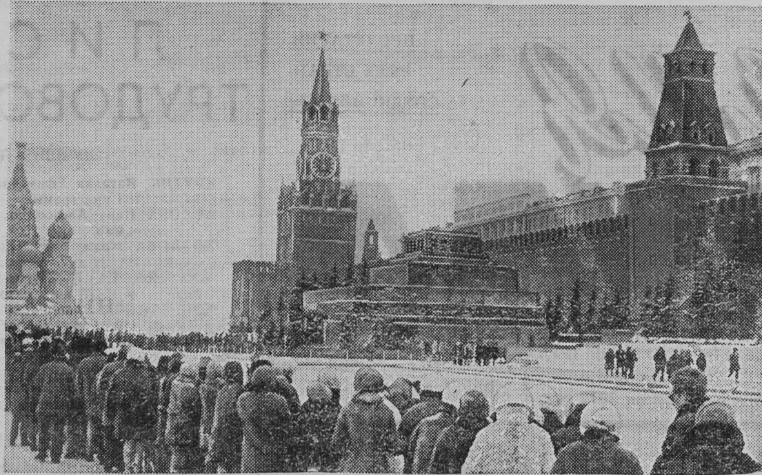
Москва. Красная площадь. Мавзолей В. И. Ленина.