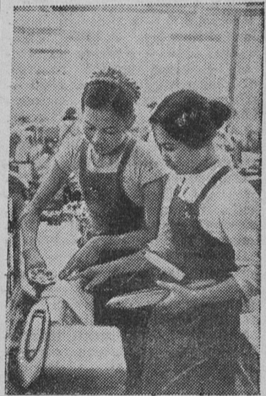
Город Намдинь — центр текстильной промышленности Демократической Республики Вьетнам. Здесь находится самый крупный в стране текстильный комбинат. Это предприятие неоднократно подвергалось варварской бомбардировке американской авиации.

Сейчас производственные корпуса полностью восстановлены. В цехах монтируются современные высокопроизводительные машины. Широко развито социалистическое соревнование за выпуск тканей сверх плана.