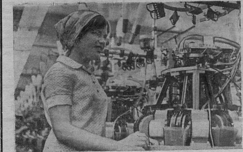
Ленинград. На одном из участков крупнейшего хлопчатобумажного цеха чулочно-трикотажной фабрики «Красное знамя» в этом году за-