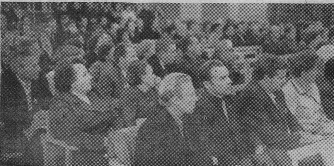
В зале заседания сессии.

Внедрение комплексной механизации в растениеводстве, применение группового метода использования техники позволили в прошлом году более успешно справиться с сельскохозяйственными работами, перевыполнить план по урожайности, производству и продаже государству продуктов растениеводства. Первыголен план по заготовке грубых и сочных кормов. В текущем году совхозы более организованно кроветели сев и уборку урожая зерновых культур.