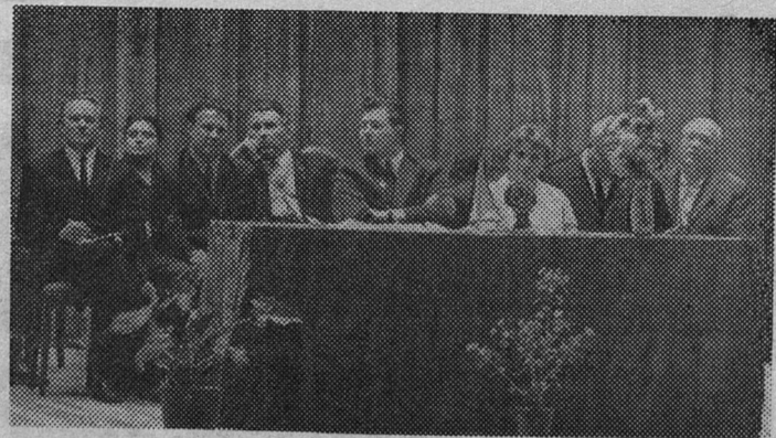
В президиуме сессии.

ДОКЛАДЧИК ПОДЧЕРКИВАЕТ, что сейчас принято за правило строящиеся животноводческие фермы сдавать с полной механизацией, которую вы-