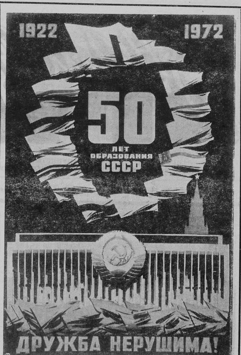
К 50-летию образования СССР издательство «Изобразительное искусство» выпустило плакат художника В. Викторова.