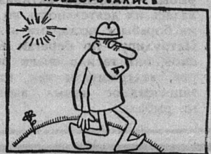
Без слов. Рис. Я. Голофриша.