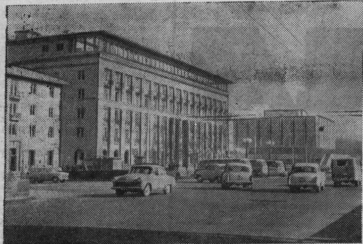
Столица Узбекистана — Ташкент. Проспект имени Владимира Ильича Ленина.