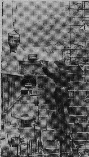
На снимке: монтаж металлоконструкций здания Нурекской ГЭС.

Нурек — воплощение дружбы народов. Его сооружают посланцы 43 национальностей нашей страны. Проектировали ГЭС 28 крупнейших проектных и научно-исследовательских институтов. Триста крупных заводов, расположенных почти во всех союзных республиках, изготовляют оборудование. Влившийся в единое среднеазиатское кольцо, электроэнергия Нурекской ГЭС сыграет исключительную роль в развитии огромного экономического района.