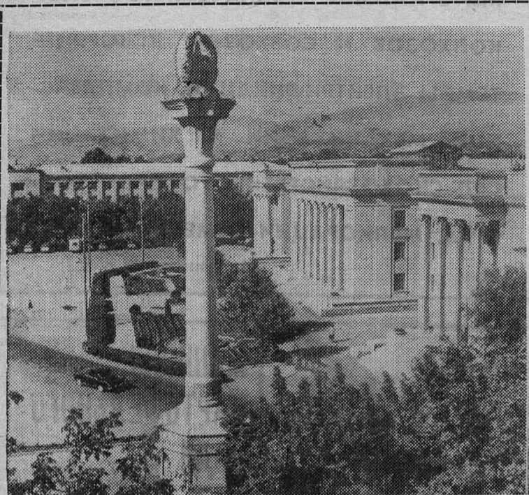
Столица Таджикской ССР — Душанбе. Площадь В. И. Ленина у Дома правительства.