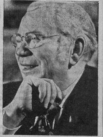
70 ЛЕТ М. М. ЯНШИНУ — НАРОДНОМУ АРТИСТУ СССР

МОСКВА. 2 ноября исполняется 70 лет актеру Московского Художественного академического театра, народному артисту СССР Михаилу Михайловичу Яншину.