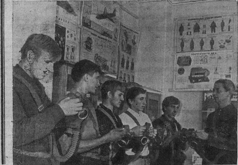
Минская область. Интересно организована работа с допризывниками на Борисовской фабрике пианино. Здесь создан военно-учебный пункт с хорошо оборудованным классом, тиром, небольшо-

шим кинозалом. Юноши изучают автомобильное дело, знакомятся со средствами противохимической защиты, сдают нормы на значок ГТО. На пункте есть Книга почета. В нее заносятся фамилии бывших рабочих фабрики, а ныне солдат, отличившихся по службе.