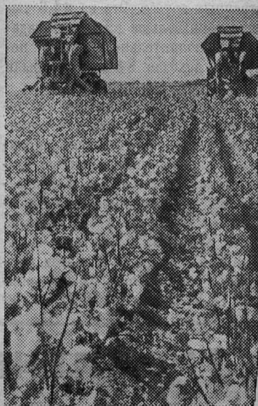
Массовую уборку хлопка ведут механизаторы совхоза «Теджен» Марыйской области. НА СНИМКЕ: уборка хлопка.

Каракумский канал — гордость туркменского народа, живое свидетельство трудолюбия, зрелости, силы, расцвета, вечной дружбы народов нашей необъятной Родины.