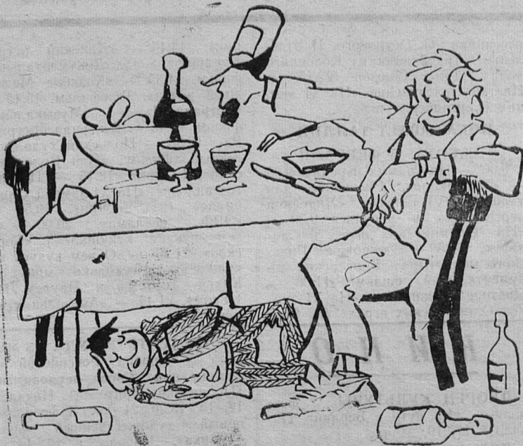
«Еще одну за встречу»