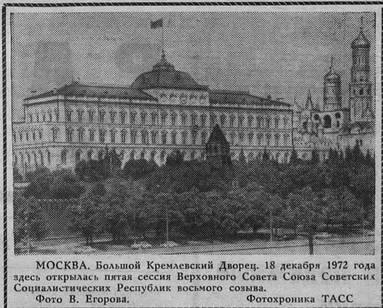
МОСКВА. Большой Кремлевский Дворец. 18 декабря 1972 года здесь открылась пятая сессия Верховного Совета Союза Советских Социалистических Республик восьмого созыва.