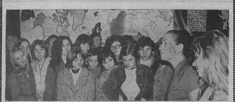
ЧЕХОСЛОВАКИЯ. В братиславском музее В. И. Ленина открыта новая экспозиция, посвященная 50-летию образования СССР. НА СНИМКЕ: внимательно слушают школьники рассказ экскурсовода о Владимире Ильиче Ленине — создателе многонационального Советского государства.

Тодор ЖИВКОВ, Первый секретарь ЦК БКП, Председатель Государственного совета Народной Республики Болгарии.