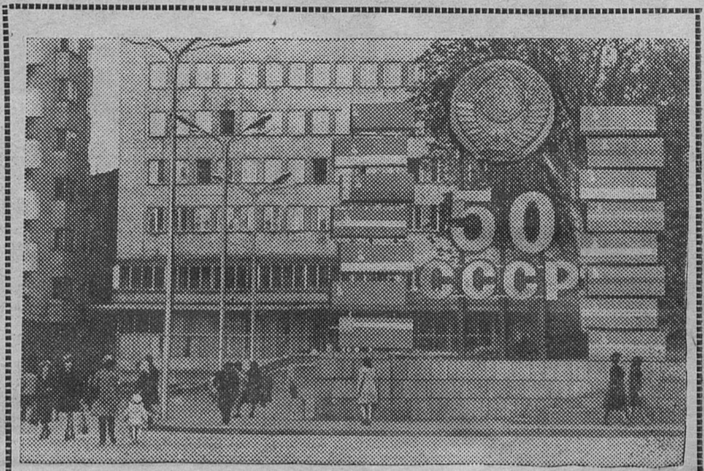
Праздничное оформление площади 9-е Сентября в Софии. Вместе с братским советским народом готовятся встретить трудящиеся Народной Республики Болгарии 50-летие образования СССР.

По своей роли и значению в общественном развитии XX века создание СССР — это событие, занимающее место рядом с Великим Октябрем, тесно связанное с ним, продолжающее и раз-