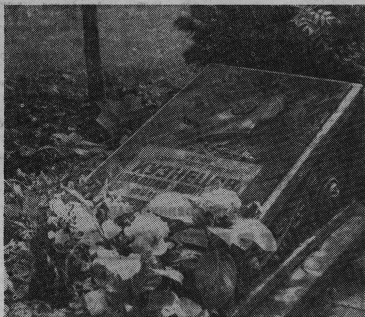
НА СНИМКАХ: (вверху) на одной из старых улиц Львова, (справа) группа сланцевских туристов во Львова, (внизу) надгробная плита на могиле легендарного разведчика Героя Советского Союза Н. И. Кузнецова.