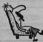
Рис. Ярослава Голофриша.