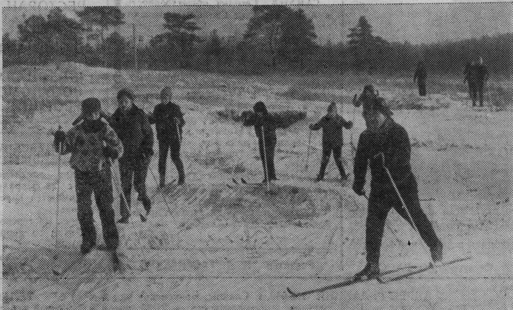
В ВОСКРЕСНЫЙ ДЕНЬ.