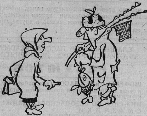
Рис. Я. Голофриша.