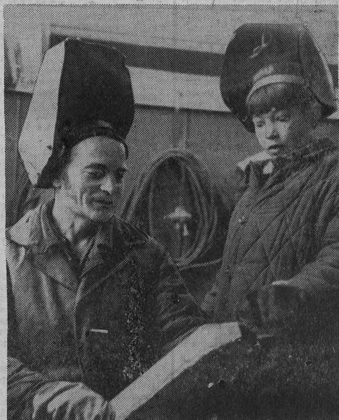
На промышленных предприятиях и стройках нашего города нередко можно встретить учащихся городского профессионально-технического училища, которые проходят там производственную практику.

Бюро городского комитета КПСС приняло постановление, направленное на устранение отмеченных недостатков и улучшение работы по научной организации труда в шахтоуправлении «Ленинградсланец».