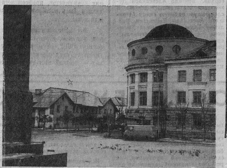
Пейзаж нашего шахтерского города.

секретарь парторганизации домоуправлений.