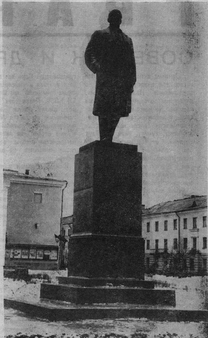
ПАМЯТНИК В. И. ЛЕНИНУ.