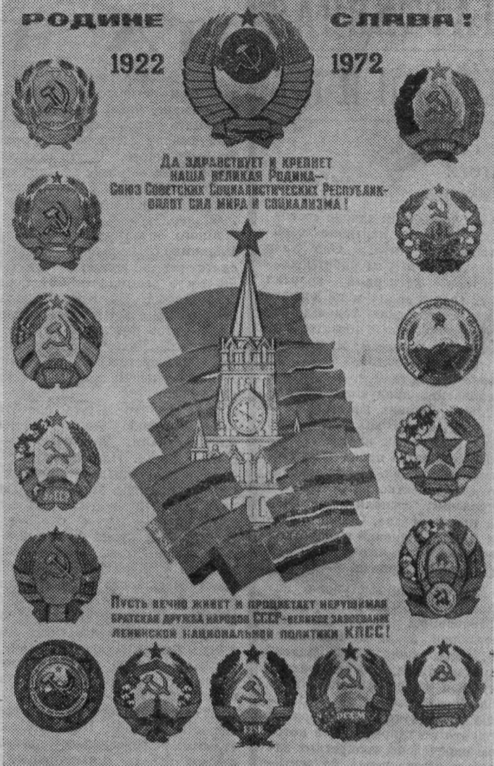
К 50-ЛЕТИЮ ОБРАЗОВАНИЯ СССР ИЗДАТЕЛЬСТВО «ИЗОБРАЗИТЕЛЬНОЕ ИСКУССТВО» ВЫПУСТИЛО ПЛАКАТ ХУДОЖНИКА К. МИСТАКИДИ.