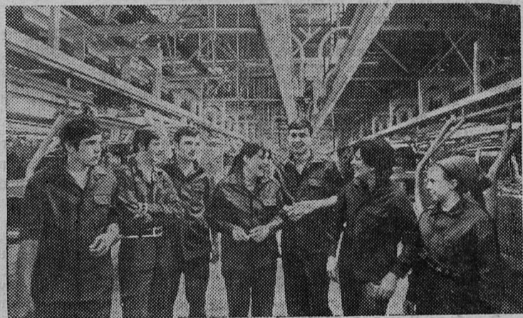
Автомобильный завод имени Ленинского комсомола увеличил свои производственные мощности. Недавно пущен новый автоматизированный сборочный комплекс. Проектная мощность нового

Сейчас в столице более 100 музеев и постоянно действующих выставок. Миллионы посетителей ежегодно регистрирует Центральный музей Владимира Ильича Ленина. Почти все гости Москвы включают в маршрут своего путешествия Выставку достижений народного хозяйства СССР. В этом году здесь представлено 100 тысяч экспонатов, отражающих успехи Страны Советов.