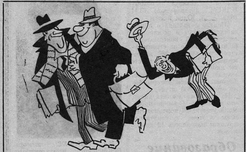
УЛЫБКА ХУДОЖНИКА — При каждой встрече с Ивановым мое мнение о нем становится все выше и выше... Рисунок Я. Голофриша.

внука и внучки пусто, пожурила их: — Нельзя же так, милые. Не в рот, а в корзинку надо собирать. Дома поедите. Ребята приналегли. И вот уже у каждого по полной корзинке. Дома, следуя совету бабушки, они приложились к ягодам. А та, увидев их возле корзинок, зашумела: — Это что же такое, а? Так и продавать нечего будет! Надо бы там, в поле, есть! г. Сланцы. В. РУСОВ.