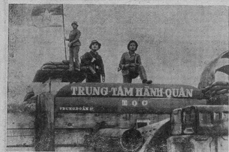
ЮЖНЫЙ ВЬЕТНАМ. Народные вооруженные силы Освобождения Южного Вьетнама продолжают вести успешные боевые операции.

НА СНИМКЕ: патриоты НВСО водрузили флаг на захваченной позиции 57-го сайгонского полка в провинции Куангчи.