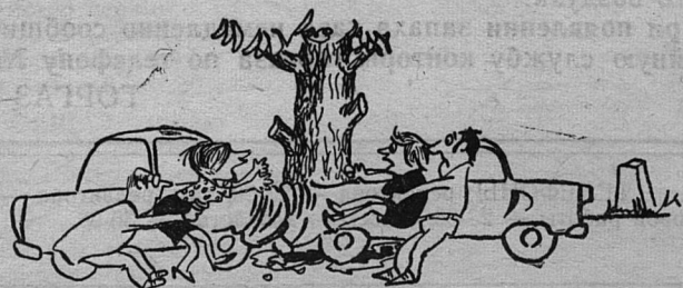
Рис. Я. Голофриша.