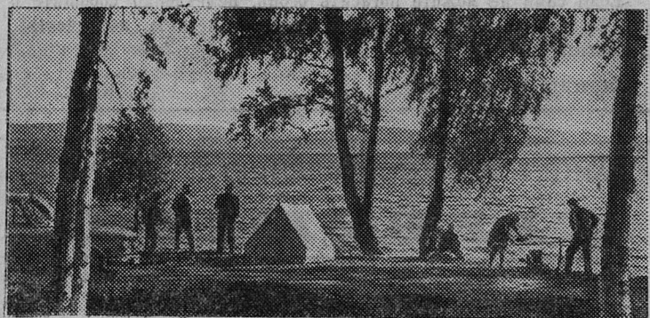
СВЕРДЛОВСКАЯ ОБЛАСТЬ. Озеро Иткуль — одно из красивейших на Урале, излюбленное место отдыха жителей области.

И. КОСТРОВ, мастер-взрывник, партгруппорг участка № 7.