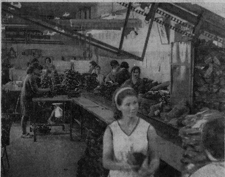
НА СНИМКЕ: сортировочно-упаковочное отделение цеха резиновой обуви.