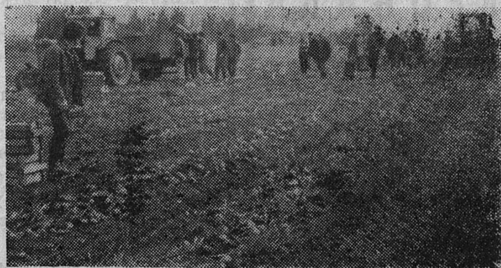
НА СНИМКЕ: работают учащиеся ПТУ № 36.

Сегодня в Москве начала работу четвертая сессия Верховного Совета Союза Советских Социалистических Республик восьмого созыва.