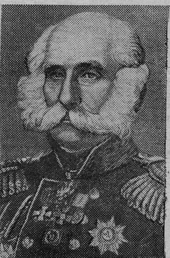
Ф. П. ЛИТКЕ

28 сентября исполнилось 175 лет со дня рождения Федора Петровича Литке (1797—1882) — выдающегося русского мореплавателя и географа XIX века, адмирала русского флота, известного своими исследованиями Арктики и двумя кругосветными плаваниями. Он исследовал берега Новой Земли, Камчатку, Чукотский полуостров, Каролинские острова, остров Бонин. Ф. П. Литке много сделал для развития русской науки. Он являлся одним из инициаторов и учредителей Русского географического общества и в течение двадцати лет возглавлял его работу. С 1864 по 1881 год Ф. П. Литке был президентом Российской Академии наук.