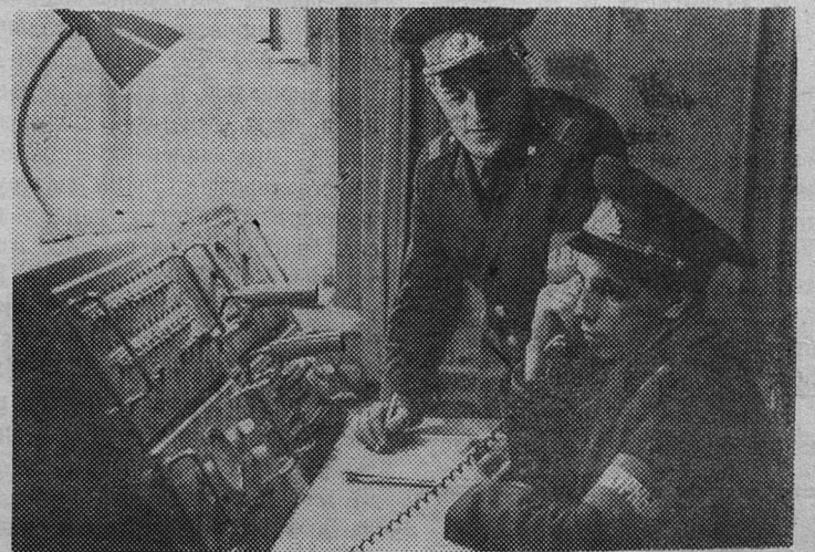
Дежурная часть. Здесь концентрируются все сведения о порядке в городе, отсюда осуществляется оперативное руководство сотрудниками.

начальник отдела внутренних дел Сланцевского горисполкома.